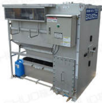
切断水循環脱水ろ過システム