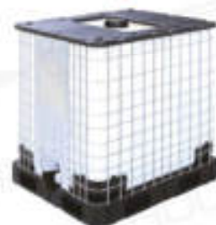
清水槽（処理後の脱離液）

ろ過システムで処理後、きれいになった水は、穿孔工事の冷却水としてリサイクルできます。また分離された汚泥は処分量が大幅削減でき、土嚢袋で処理できます。